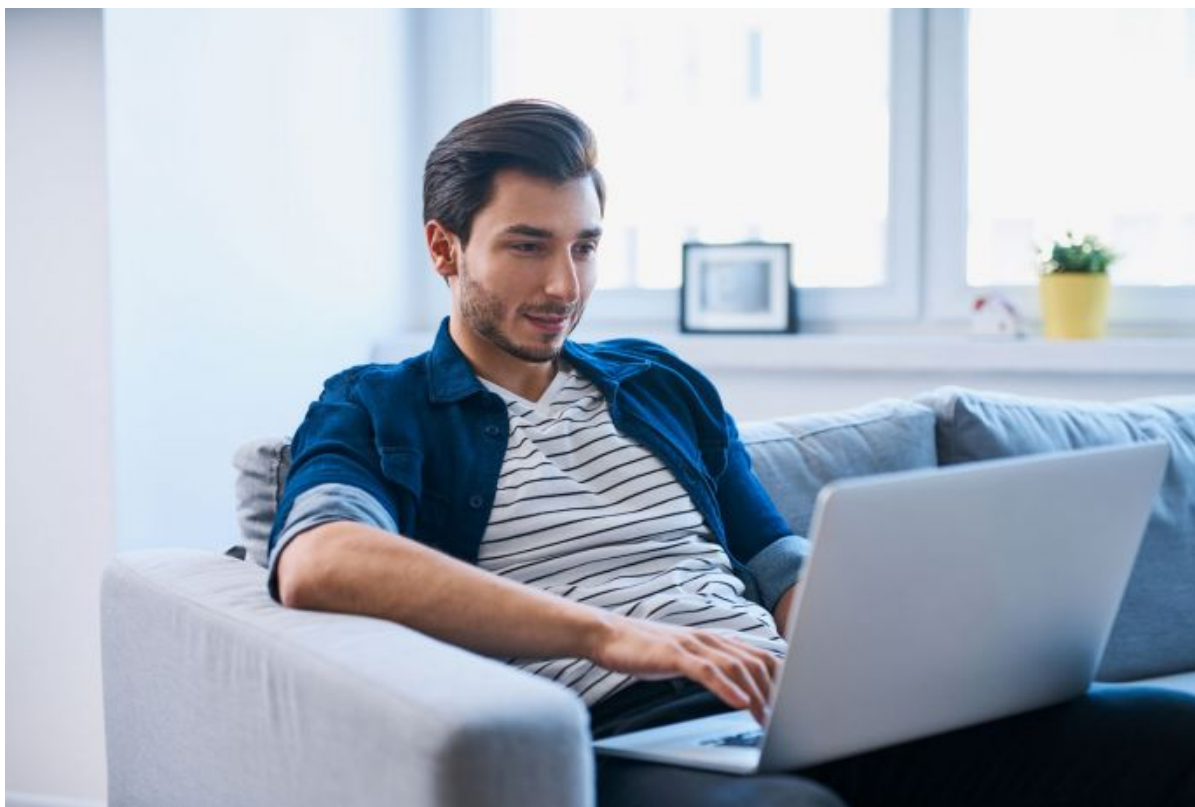
Étudiant visitant un salon étudiant depuis son salon d'étudiant.

Sur les salons étudiants, un simple mouvement du poignet permet désormais de passer d'un stand à l'autre. Nous ne sommes pas sur un salon physique classique, comme on en trouve fréquemment dans les grandes villes, mais bien sur internet, au sein d'un salon virtuel.